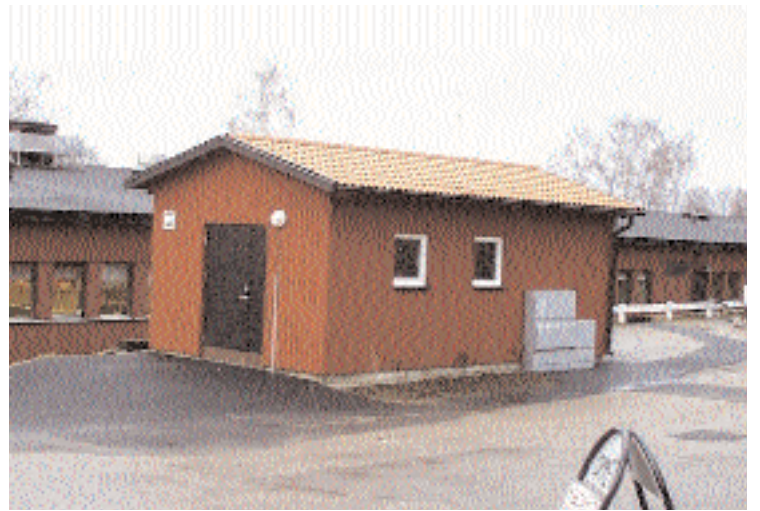
Ett rejält tilltaget sophus på mark som enligt planen inte får bebyggas blev resultatet när miljönämnden lämnade undantag från den nyss godkända detaljplanen.

Trots att en lång och svår process till slut ledde fram till att detaljplanen antogs så beviljade miljönämnden, bara några dagar efter att planen vunnit laga kraft,