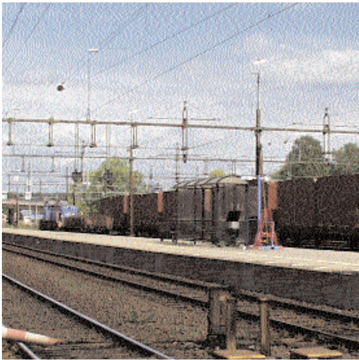
Ombyggnationen av bangårdsområdet öppnade plötsligt upp möjligheterna att flytta ut godsbangården till Gustavsberg. Nya stora utvecklingsmöjligheter öppnar sig för kommunen om förslaget blir verklighet.