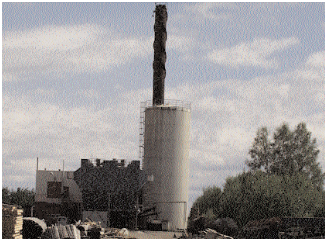
Värmeverket i Alvesta kommer under året att kompletteras med en ny panna. Alvesta Energi kommer också att ta över ansvaret för drift och underhåll av anläggningen från Alvesta Träförädling AB.

Styrelsen i Alvesta Energi ansåg inte motpartens krav affärsmässiga. Man hade ju redan tidigare under året ingått ett avtal i Moheda på en nivå som accepterats av bränsleleverantören där. Man började nu