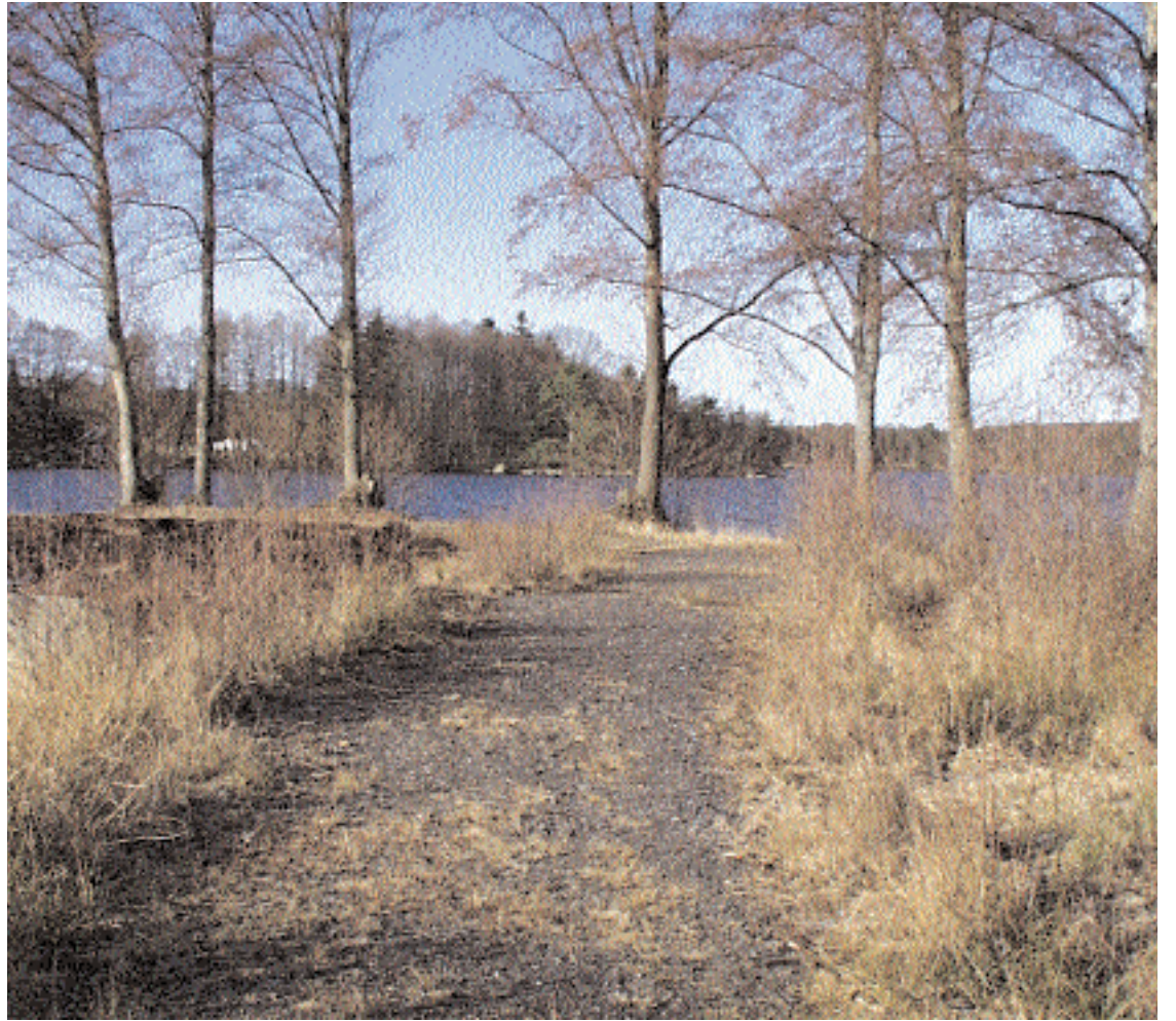
Ingvar Roos har byggt sin egen strandpromenad längs med Sjöatorpsjöns strand på den gamla sågverkstomten. Framtidsvisionen måste vara att knyta samman den med den nu planerade strandpromenaden till Losbadet.

Vi hoppas få återkomma både i ord och bild om ett par år, då både båthamn och strandpromenad är färdiga och då kräftfiskekvällarna i Hjortsberga blivit en festlig augustitradition.