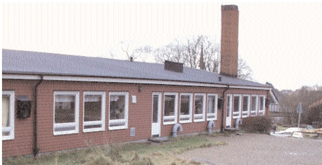
Prästängsskolan har alltför länge dragits med mögelrykten utan att man gått till botten med problemen.

AllboHus har lovat att ta krafttag för att en gång för alla komma till rätta med problemen, som redan nu orsakat onödigt lidande. Tyvärr så har både elever och personal under tiden utvecklat allergi. Det är nödvändigt att man verkligen går till botten med problemen så att de inte återuppstår och riskerar hälsan för elever eller personal. Något bör alla ha lärt sig av detta, nämligen att ta alla signaler på allvar redan från början.