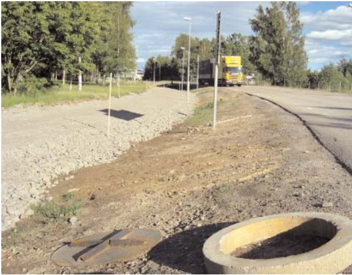
Cykelvägen utefter Fabriksgatan i Alvesta innan asfalten kom på plats tidigare i somras.