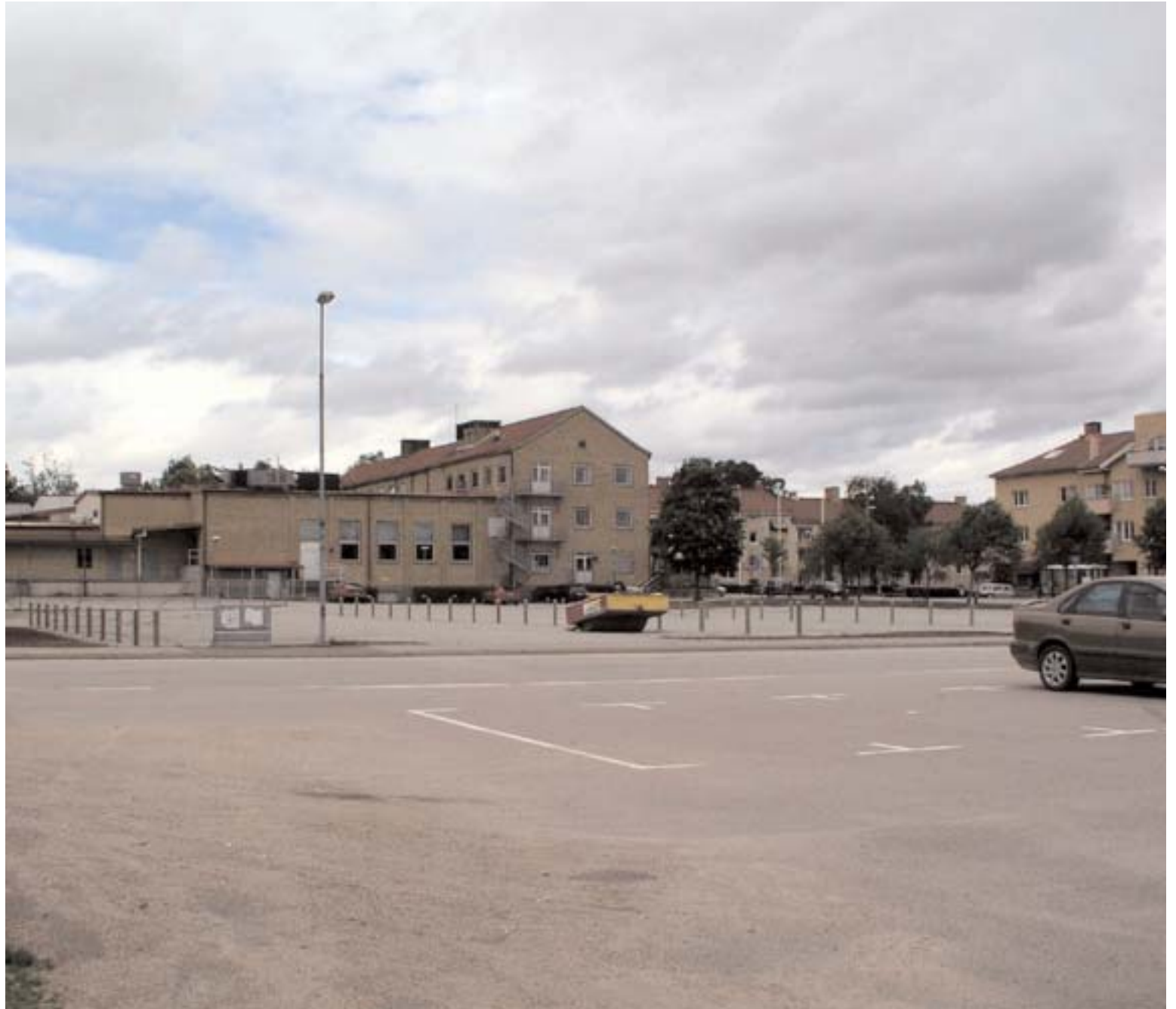
Visst är det bra att vi nu får ett stort antal nya parkeringsplatser i centrala Alvesta. Men med tanke på hur området sett ut under väldigt lång tid frågar vi oss ändå varför bygglovsreglerna inte följts? Gäller de inte längre för det kommunala fastighetsbolaget AllboHus och har bolaget tagit över ansvaret i sådana här frågor från kommunen?

Det är kanske så att framtidsplaneringen i Alvesta kommun numera sker i AllboHus regi. I alla fall får allmänheten det intrycket oavsett om det handlar om nya parkeringsplatser i