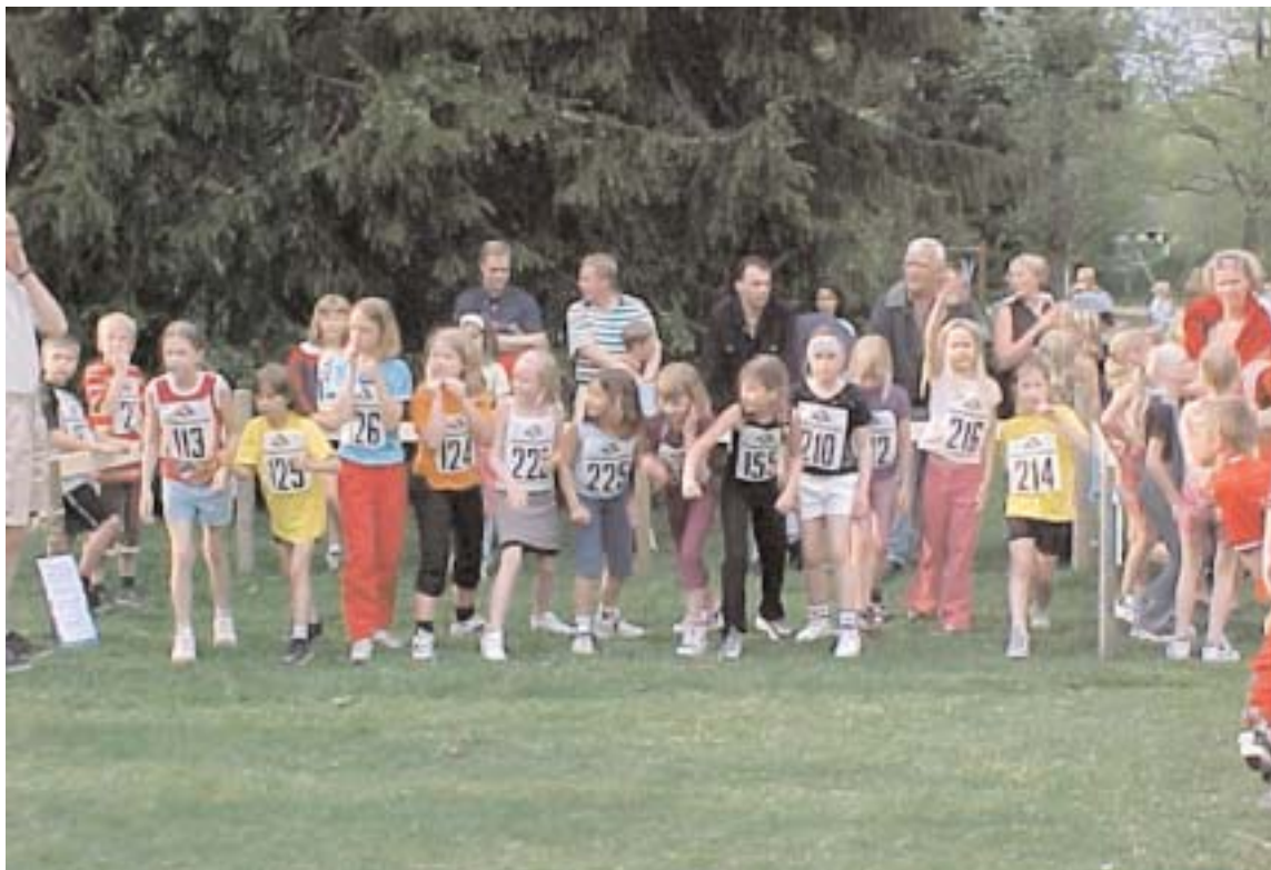
Vem som i framtiden skall handha de olika grenarna inom fritidsförvaltningen vet ingen idag. Föreningar och organisationer får vänta fram till november innan man får svar på den frågan.

Vi ställer oss också frågan om det nu blir ett än större sparbetting för att hämta in de ökade kostnaderna om ungefär 420 000 kronor för övertidsersättning till de 16 enhetscheferna?