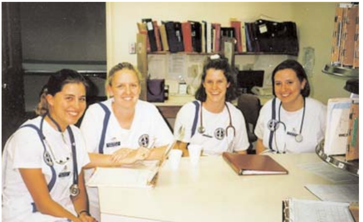
Är man i behov av en plats inom äldreomsorgen är närheten till personalen en trygghet inte bara för omsorgstagaren utan även för de anhöriga.