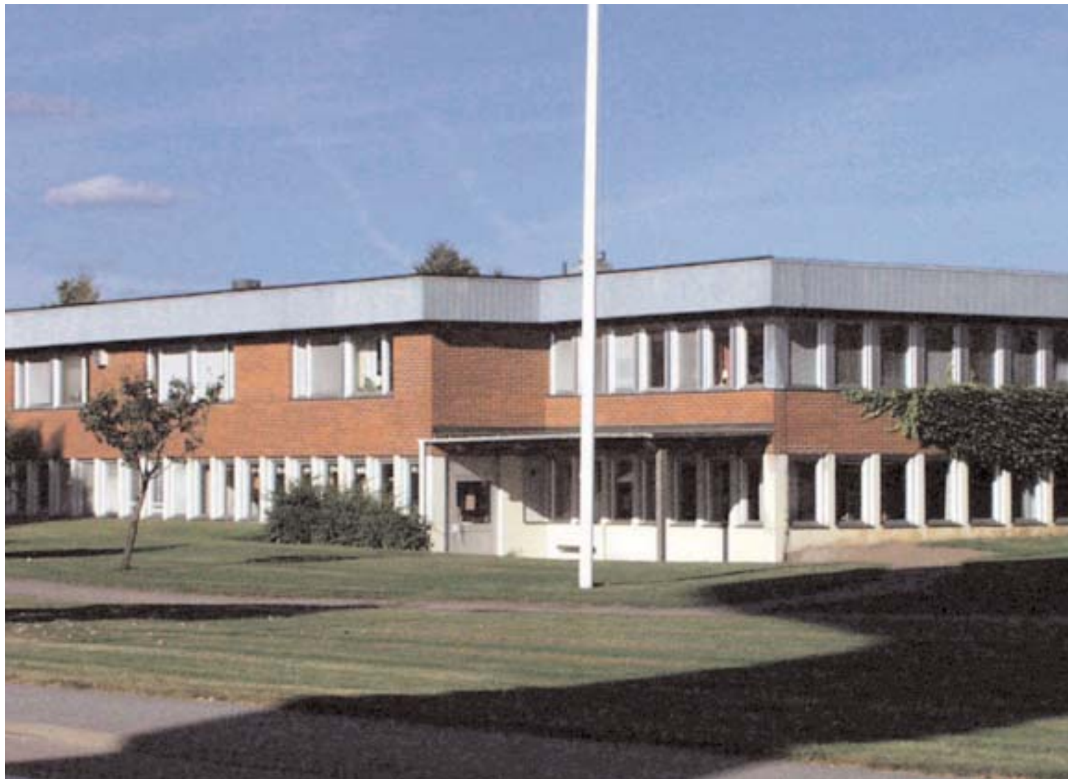
Beslutet om Högåsens framtid har än en gång skjutits upp. Men tyvärr förefaller det som beslutsfattarna inte har lärt sig någonting! Än en gång vill de kraftigt reducera antalet platser inom äldreomsorgen. Den borgerliga majoriteten och socialdemokraterna står nu i begrepp att köra över opinionen på samma sätt som när det gällt räddningstjänsten och Stenlyckeskolans nedläggning.

Kommuninvånarna har under senare år kunnat ta del av hur just socialkontoret i Alvesta nekar äldre människor plats inom äldreomsorgen och tvingar dem att i stället med anhörigas hjälp driva rättsprocesser för att hävda sin rätt till en omsorgsplats. Är det detta byråkraternas sysslar med bakom sina skrivbord? Istället för att resurserna läggs på vårdperso-