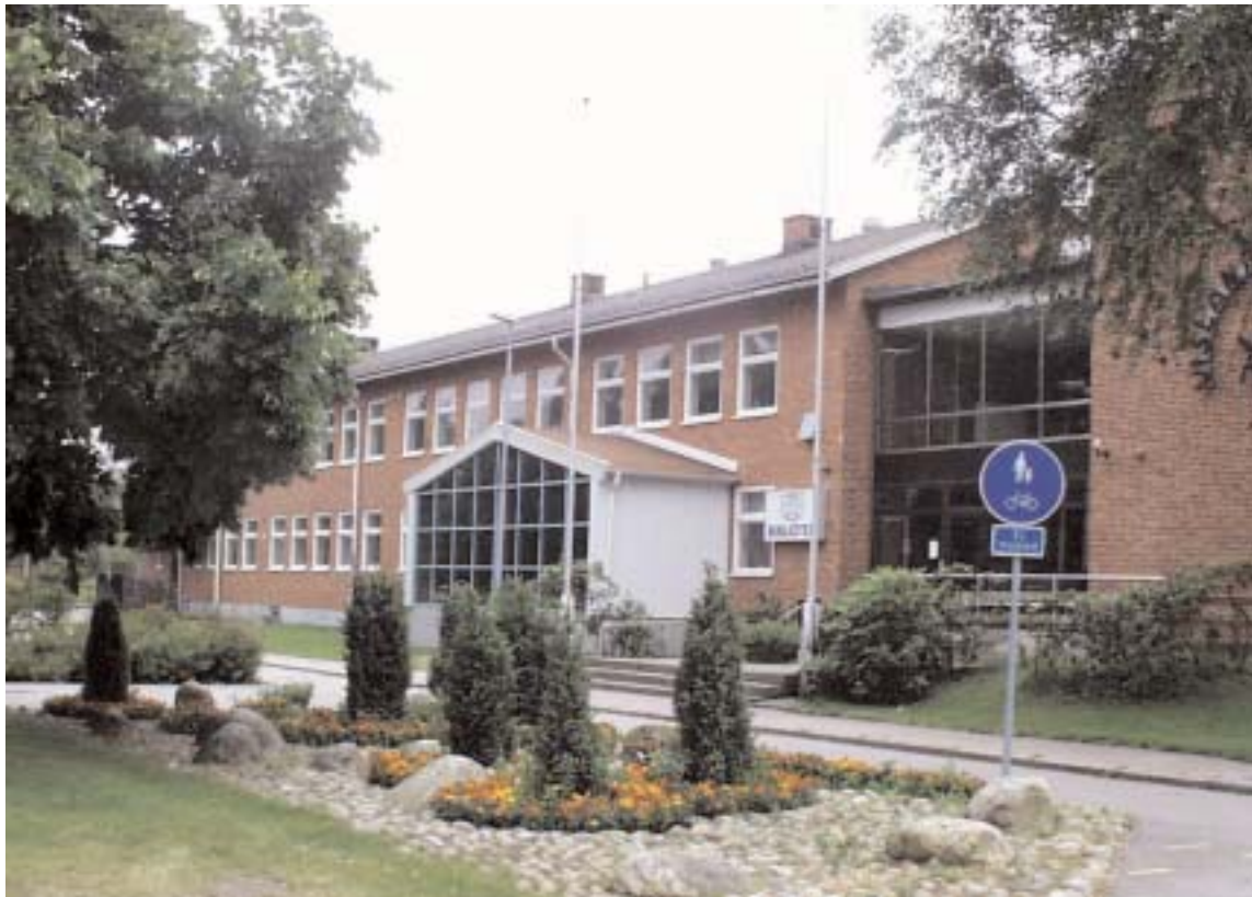
Moderaterna, som vanligtvis brukar vara emot fler politiker, vill tillsammans med (s) fördubbla den politiska skolorganisationen i Alvesta kommun.

Alvesta Alternativet förordar en bibehållen organisation med det undantaget att en av de båda vice ordförandeposterna avvecklas. Dessutom vill Alvesta