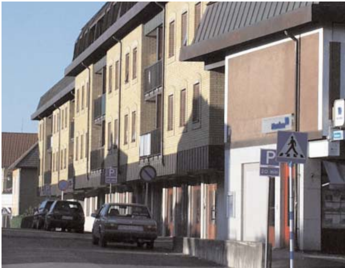
Underskottet på Rådmanen ska enligt kommunledningen i fortsättningen tas från AllboHus vinst. Eftersom bolagets vinst ju skapas genom hyresintäkter från hyresgästerna, innebär det alltså att hyresgästerna i fortsättningen ska stå för underskottet.

Oavsett vilket som är sanning så blir summan att underskottet