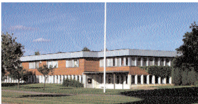
Trots att socialförvaltningen påstår att det inte finns någon äldreomsorgskö väntar redan nu flera boende på Högåsens korttidsboende på en plats. Hur ska det då blir om antalet omsorgsplatser skärs ner?

Det finns ingen kö till äldreomsorgsplatser i särskilt boende i Alvesta kommun.