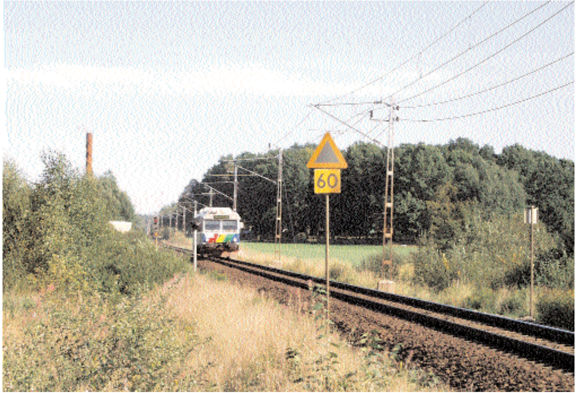
Det nya triangelspåret kommer att se ut ungefär som Göteborgsbanan gör idag. Bilden tagen vid Lyckegård utanför Alvesta när det nyinsatta Krösätåget passerar.

Lite av den debatt som i sommar blossade upp på sina håll har stora likheter med den debatt som fördes när stambanan en gång i