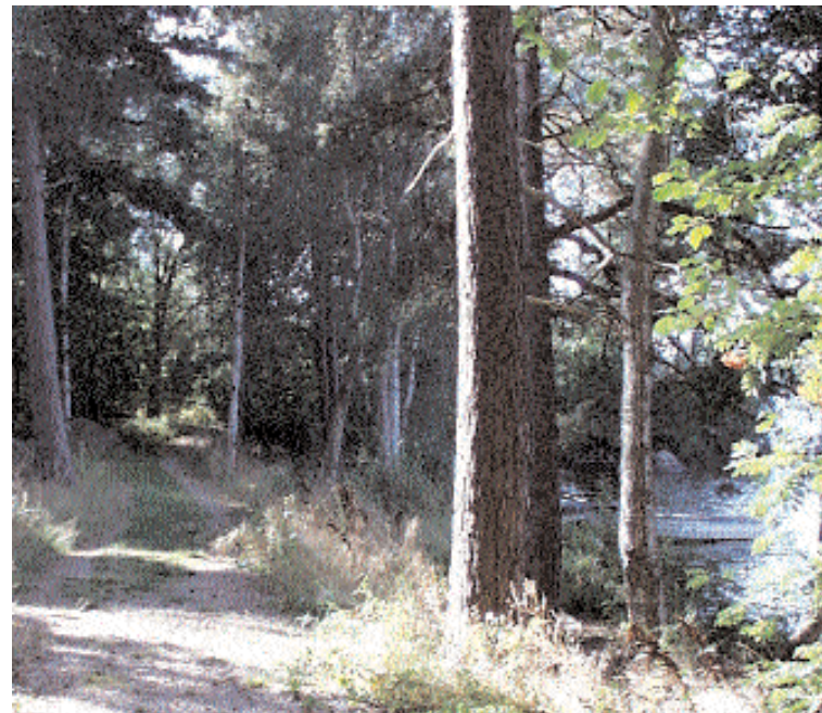
Den första delen av strandpromenaden inbjuder till vackra vyer längs Sjöatorpsjöns strand.

från kräftfisket så hoppas andra etappen skall kunna slutföras under vinterhalvåret.