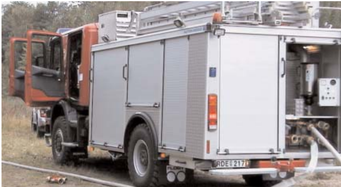
Räddningstjänsten i Alvesta kommun rustas nu ner, tvärt emot alla löften sedan räddningstjänstförbundet bildades. På den administrativa sidan verkar heller inte mycket fungera.

Räddningstjänstförbundet uppfyller inte givna löften. Bemanningen på Alvesta brandstation skulle inte röras enligt de löften som gavs vid förhandlingarna. Idag är de löfena som bortblåsta.