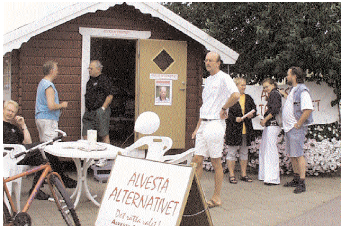
Under den sista veckan i valrörelsen kan du träffa oss från Alvesta Alternativet i vår valstuga norr om ICA i Alvesta. Välkommen in på en kopp kaffe och för att hämta valsedlar eller ställa frågor till oss!

hushållar förnuftigt med vår gemensamma och begränsade kommunkassa. Vi försöker se till att förslag och beslut så långt det är möjligt är till gagn för så många av kommuninvånarna som möjligt.