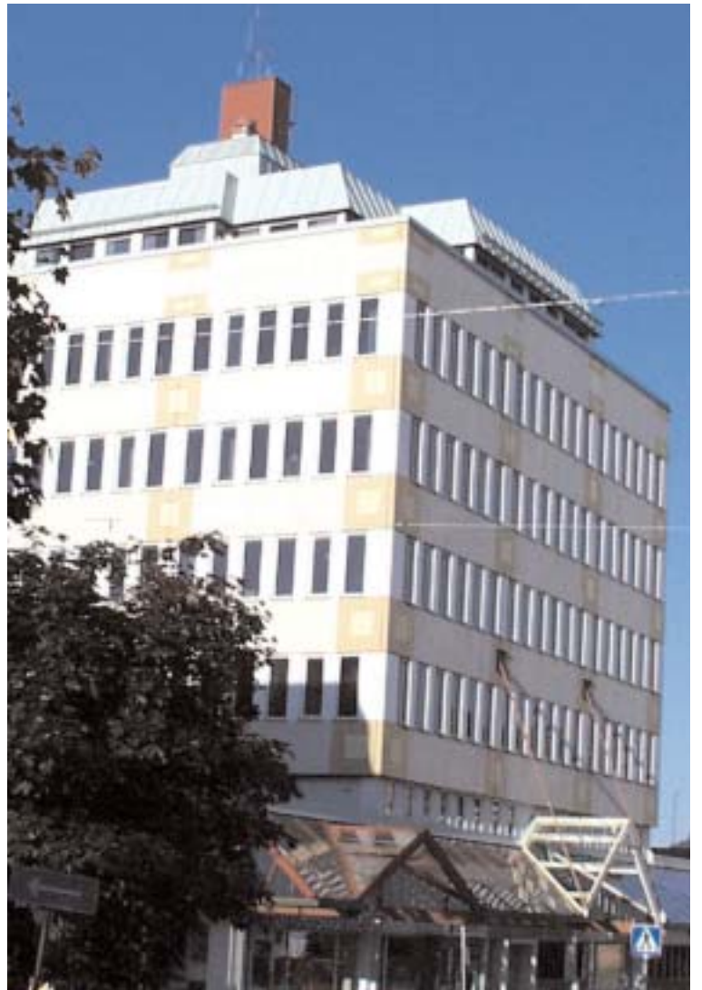
Det interna bråket inom majoriteten visar med all önskvärd tydlighet att de inte längre är regeringsdugliga.

Vilken politisk inriktning politiken har är tydligen en bisak för centern, men knappast för en undrande väljare. Vem vågar sig på en röst på centern när man inte vet om partiet är fågel eller fisk?