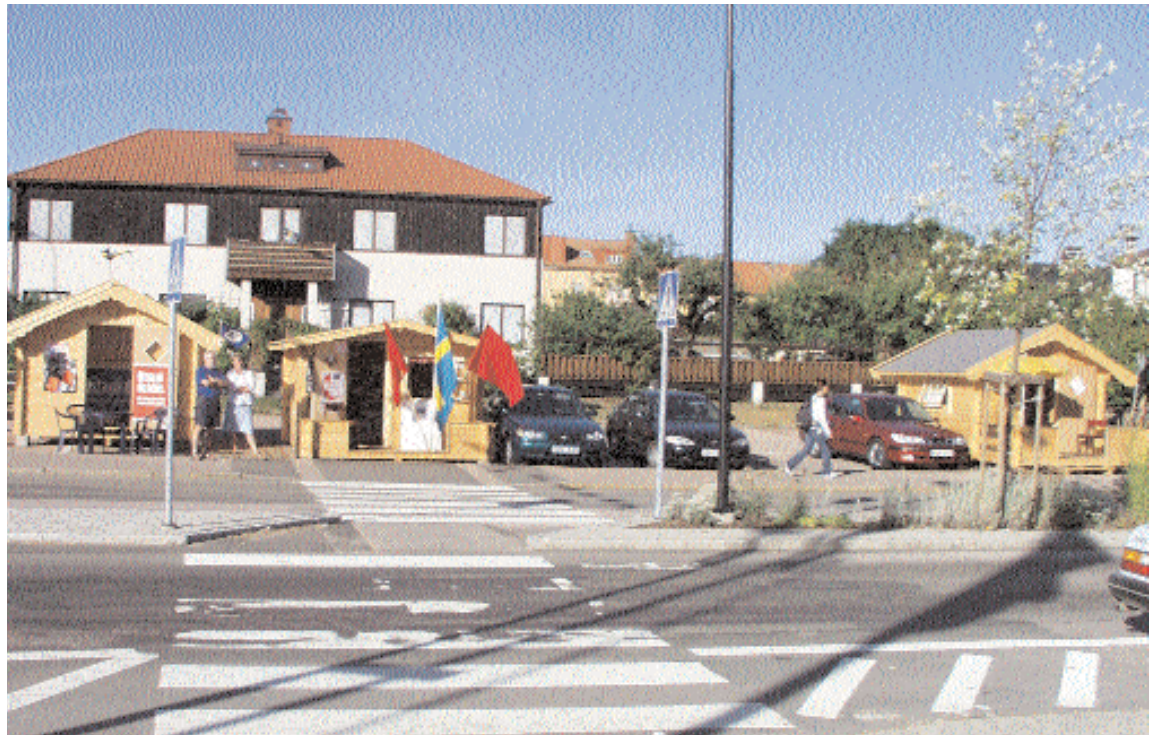
Moderaterna valde att flytta sin valbod till högerflanken. Ett riktigt val för annars hade man hamnat mitt i skottlinjen i det pågående ordkriget mellan socialdemokrater och centerpartister.