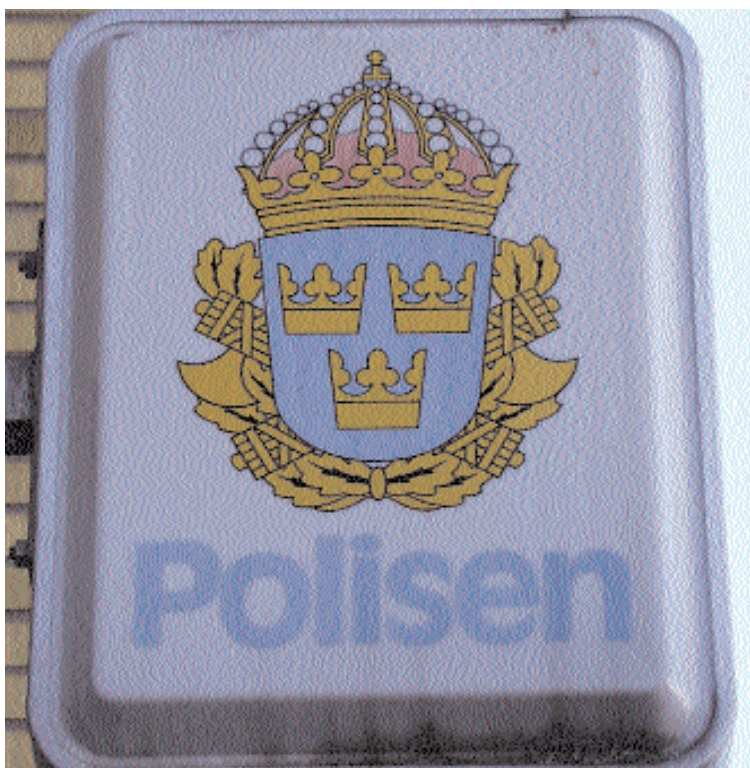
Polisens bemanning i Alvesta kommun är under all kritik. Problemet har varit känt länge, men först några veckor innan valet agerar den socialdemokratiskt ledda majoriteten och försöker inkassera billiga poäng.

Brev om att kriminella asylsökande ska utvisas ur landet har sänts till bland annat polismyndigheten i länet. Alvesta Alternativet är naturligtvis nöjda med att socialdemokraterna efter