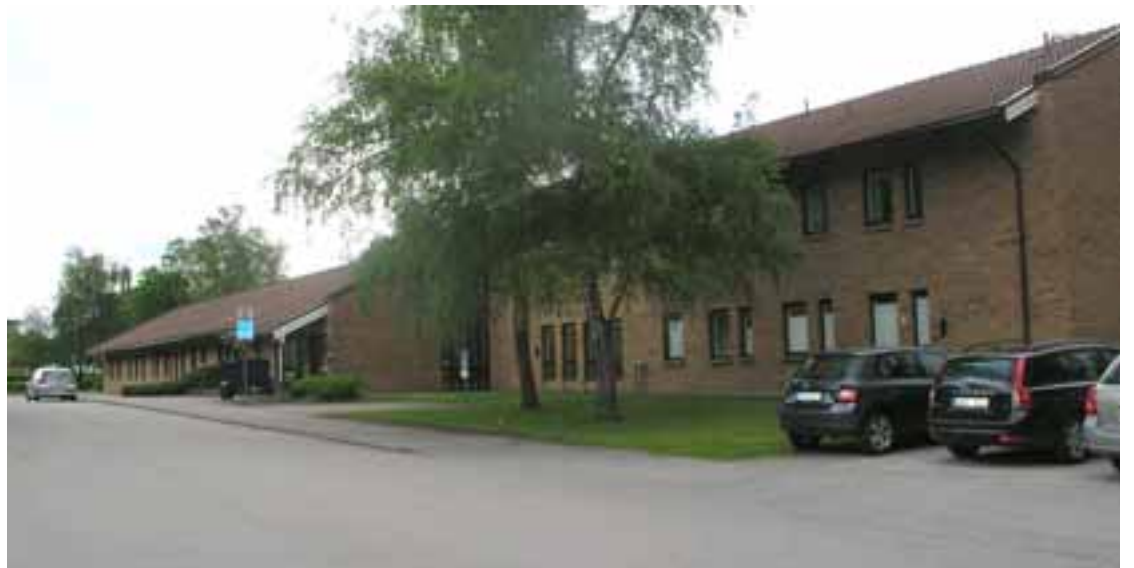
Moheda vårdcentral brukar stängas ned under semestertider medan patienterna vanligtvis hänvisas till Alvesta Vårdcentral. Den senare har haft stora svårigheter med bemanningen och utgör knappast ett bra alternativ i en redan akut situation.

Regionen måste snart steppa upp och ta det ansvar för "den nära vården" som man sedan en tid använts sig av som universallösning. Det går därför inte att sommar efter sommar hänvisa ortsbefolkningen till Alvesta Vårdcentral eller andra vårdinrättningar långt ifrån de läkare som man vant sig vid.