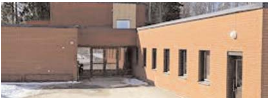
Djupa Kajäng i Vislanda byggdes en gång för fritidsgård, biograf och samlingslokal

Liknande saker har i stort sett blivit resultatet runt om i kommunen. Den mycket populära aulan i Grönkullaskolan gjordes om för klassrumsundervisning. Resultatet blev att de fasta bänkarna slängdes ut och lokalen avdelades provisoriskt med skärmväggar för att kunna användas som fyra klassrum. Ett experiment som misslyckades