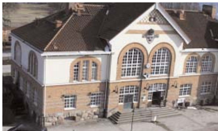
Tillgängligheten med bil till Alvesta Resecentrum kommer att försvåras avsevärt om de framtagna planerna verkställs. Också framgent måste lämnning och hämtning av passagerare och dess bagage kunna ske med bil.

Hela förslaget är dock kontroversiellt eftersom tillgängligheten för tågresenärer, som kommer till Alvesta med bil blir starkt försämrade. Att enbart lägga prioritet på gång- och cykeltrafik går inte då de flesta tågresenärerna kommer från omlandet och har bagage att ta hänsyn till. Nu öppnas det upp för ny syn på lösning när projektet får ta en ny runda. Förhoppningsvis har man nu mer tid att höra också olika företag men också allmänheten om deras syn på förslaget.