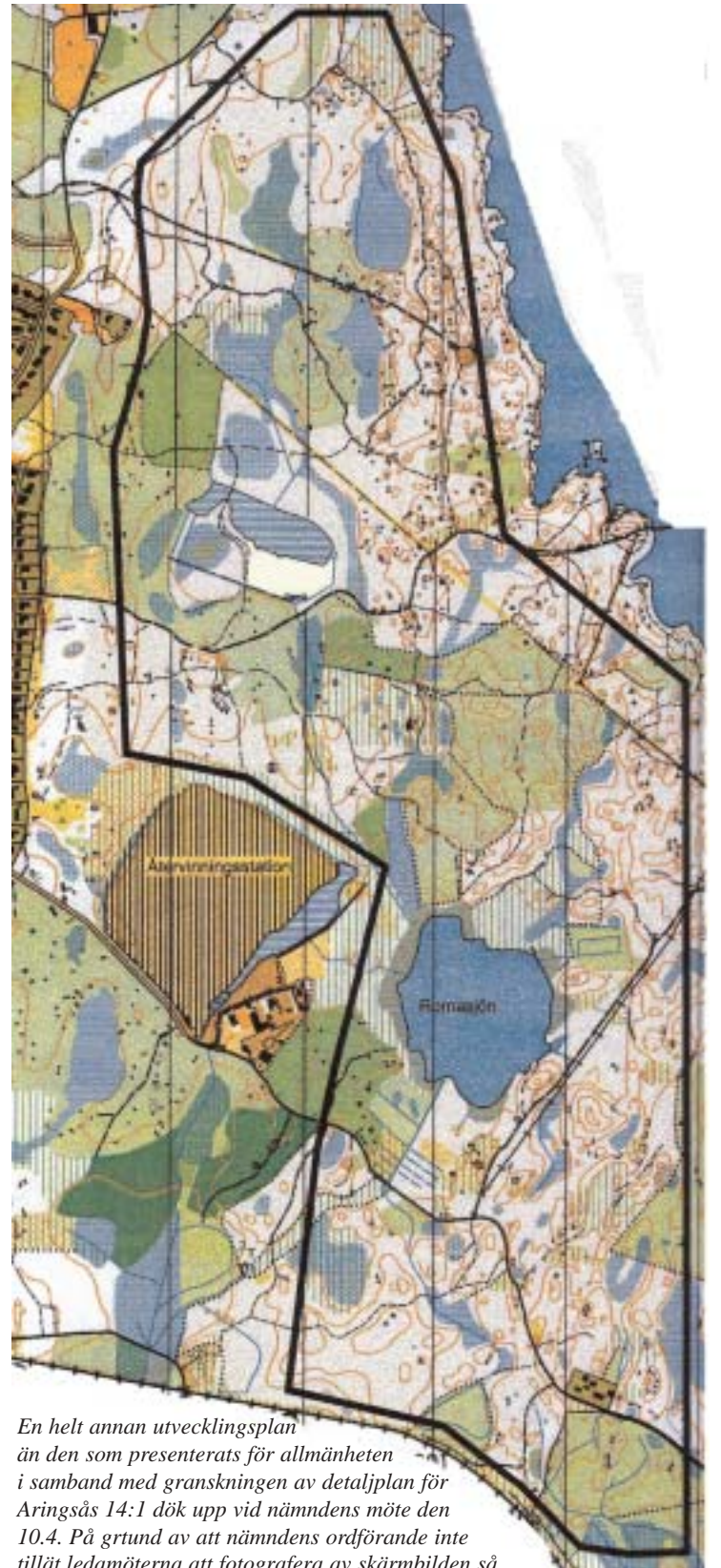
En helt annan utvecklingsplan än den som presenterats för allmänheten i samband med granskningen av detaljplan för Aringsås 14:1 dök upp vid nämndens möte den 10.4. På grund av att nämndens ordförande inte tillät ledamöterna att fotografera av skärmbilden så är området en minnesbild som nedtecknats i efterhand.