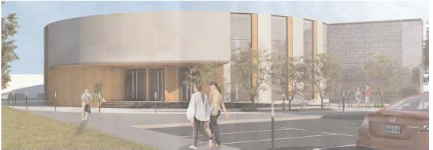
Den tilltänkta moskén eller kulturcenter är ett gediget bygge där de 100 parkeringsplatserna inom tomten lär svårt att svälja alla besökare vid de större evenemangen. Större ytor lär behövas vid välbesökta arrangemang.

Samtidigt har inte det vägts in att kommunen planerar en förändring av korsningen Fabriksgatan/Värnamovägen vilket innebär att utfarten från