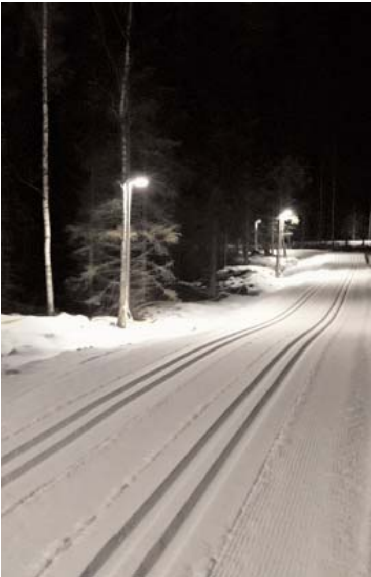
Årets säsong har bjudit på fantastiska förutsättningar både för de alpina åkarna och längdåkarna. Här en bild från den nyanlagda slingan.

Årets sena vinter blev ändå ett rekordår för alla verksamheter vid Hanaslövsområdet i Alvesta.